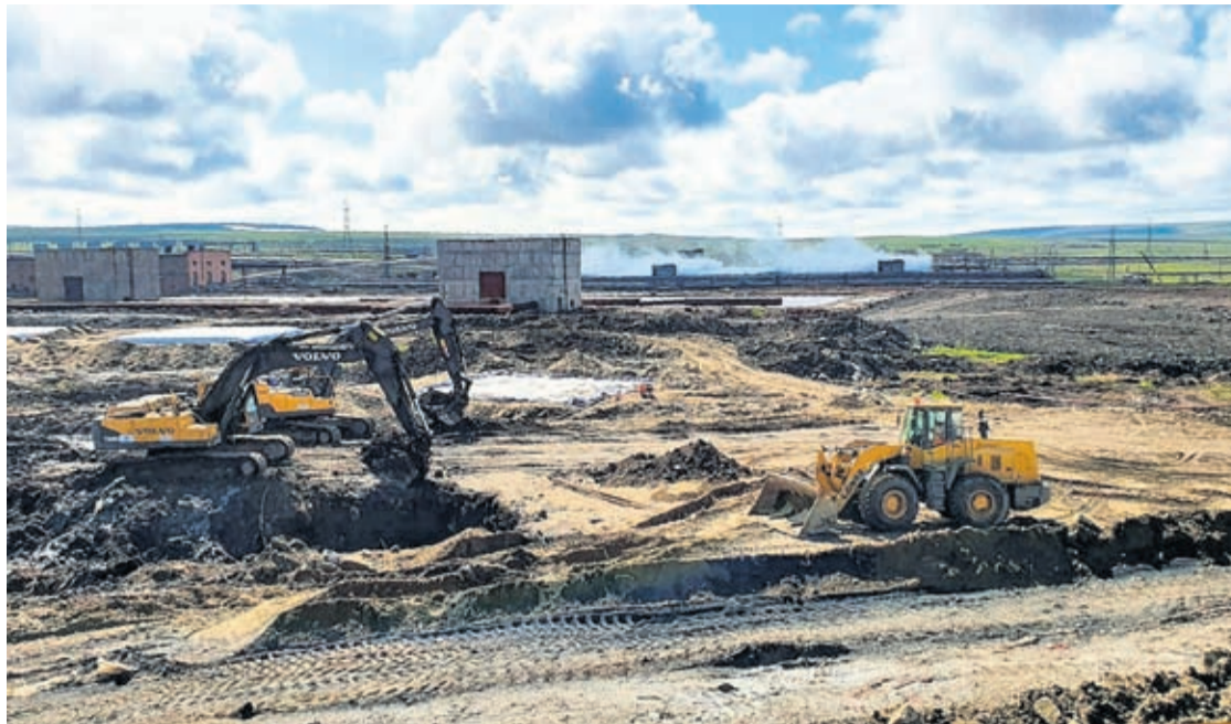
In this Thursday, June 18, 2020, handout photo provided by the Russian Emergency Situations Ministry, workers prepare an area for reservoirs for soil contaminated with fuel at an oil spill outside Norilsk, 2,900 kilometers (1,800 miles) northeast of Moscow, Russia.

Siberia is in the Guinness Book of World Records for its extreme temperatures. It's a place where the thermometer has swung 106 degrees Celsius (190 degrees Fahrenheit), from a low of minus 68 degrees Celsius (minus 90 Fahrenheit) to now 38 degrees